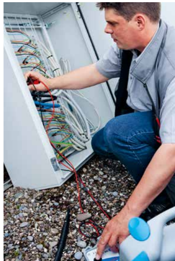
Messung einer Photovoltaikanlage

Der Photovoltaikmarkt bietet in Zukunft grosses Potenzial, von dem auch die Elektrobranche in hohem Masse profitieren kann.